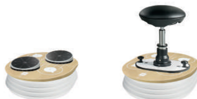
ПОДСТАВКИ ДЛЯ НОГ

МАКСИМАЛЬНАЯ НАГРУЗКА НА ПЛАТФОРМУ: 140 кг